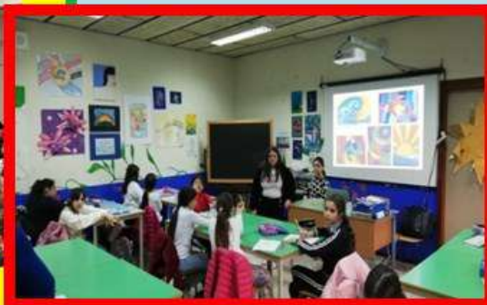
SECONDARIA DI PRIMO GRADO

Nei giorni 17, 18 e 19 gennaio 2023, si è svolto l'Open Day, un evento organizzato per far conoscere alle famiglie l'offerta formativa del nostro Istituto. La scuola è stata aperta anche nel pomeriggio e alcuni alunni della scuola secondaria di I grado hanno collaborato con i docenti nei vari laboratori didattici: Biblioteca, Palestra, laboratorio linguistico e multimediale. Dopo il discorso di benvenuto del D.S. che ha ricordato l'importanza di questa attività per tutta la nostra Comunità educante, i genitori hanno visitato i locali della scuola, accompagnati da docenti ed alunni in un tour degli ambienti scolastici. L'attività è stata importante anche per il confronto tra le esperienze degli alunni di ordini di scuola diversi, con il supporto delle insegnanti che li hanno accompagnati. Gli alunni hanno vissuto un'esperienza di condivisione importante e si sono resi protagonisti di attività programmate nei diversi laboratori.