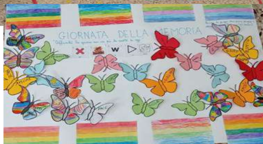
“Bandiere della pace” Infanzia - Primaria