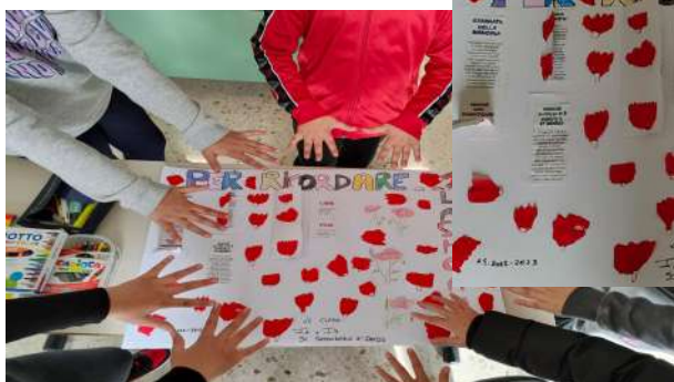
Scuola secondaria di primo grado Classi 1^A—1^ B—2^C